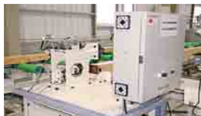
グレーディングマシン