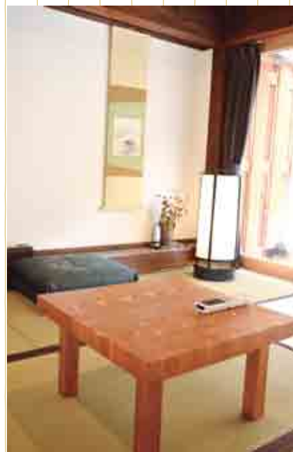
サイドテーブル (大字武蔵・古民家大森の郷)