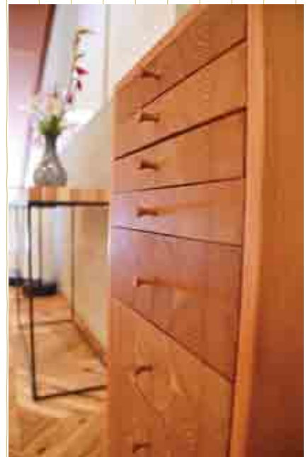
チェスト (大字平谷・十津川温泉ホテル昴)