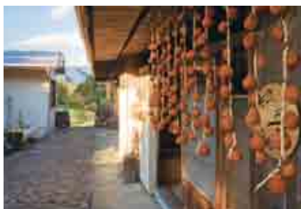
果無集落をとおりる世界遺産。住民の生活にもなくてはならない大切な道