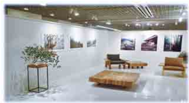
十津川産材で製作された家具 村内外で広くPR(写真:東京の新宿パークタワービルでの様子)