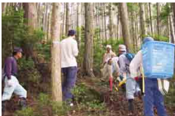
境界の明確化への取り組み 村が指定したモデル地区で行われたくい打ち

現在、村・県・森林組合・認定事業体で協議会を設立して境界の明確化を進めています。さらに、村が村内にモデル地区を指定して明確化を進めています。