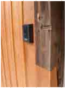
改修 (大字武蔵・古民家 大森の郷)