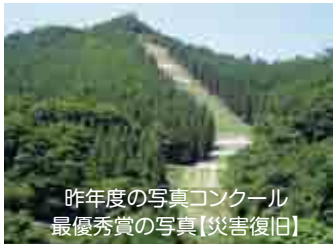
昨年度の写真コンクール 最優秀賞の写真【災害復旧】