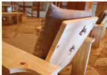
チェア (大字平谷・十津川温泉ホテル昴)