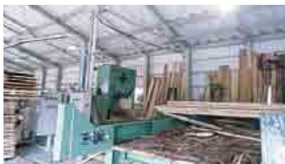
帯鋸盤(おびのこばん)