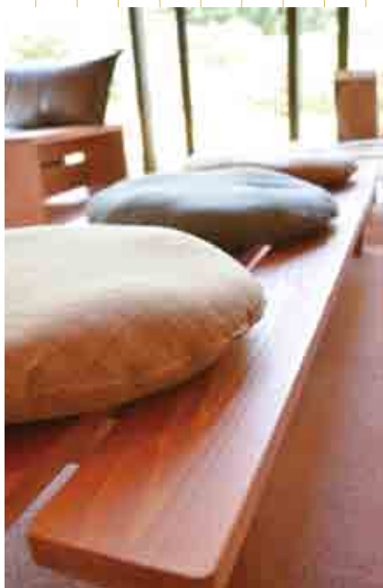
ベンチ (大字平谷・十津川温泉ホテル昴)