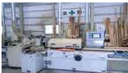
自動四面鉋盤(じどうよんめんかんなばん)