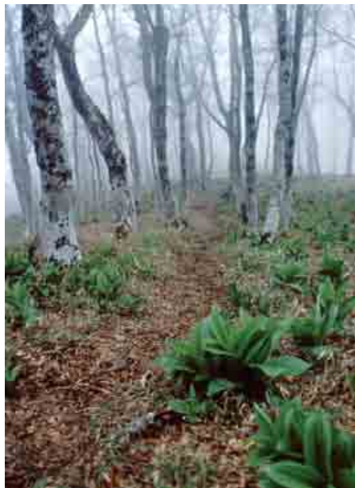
6月の釈迦ヶ岳。コバイケイソウが登山者を出迎えてくれる