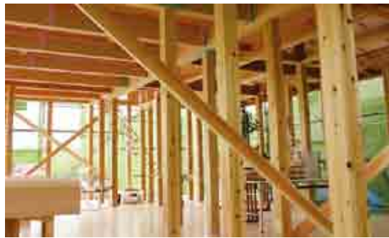
産直で顔の見える住宅づくり

ネットワークでは、建築する住宅の材がどのような環境で育てられてきたかなどが施主に分かる「顔の見える住宅づくり」を展開し、これまで130棟以上の産直住宅が建設されています。