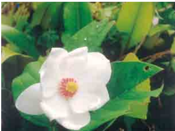
挿し木で育てたオオヤマレンゲ。県内では、大峰山陵部に自生地がある