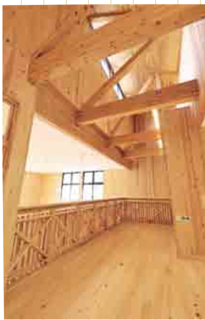
十津川中学校の内装 (大字小原・十津川中学校)