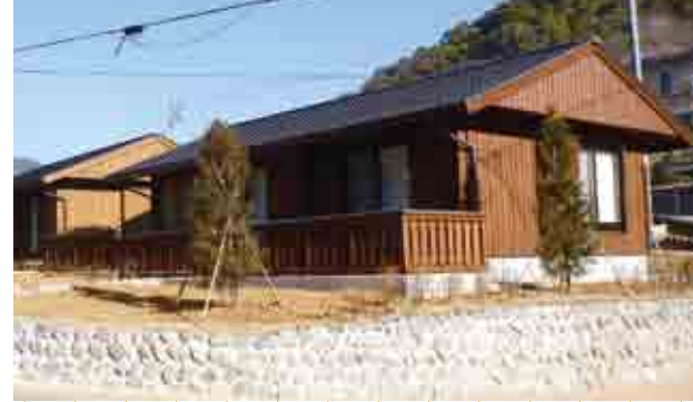
復興住宅外観(大字猿飼・高森団地)