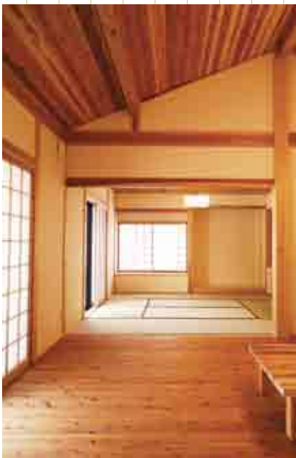
復興モデル住宅の内装 (大字林・復興モデル住宅)

ただ単に木を売るのではなく、先人が育ててきた木に感謝し、山に恩返しをしたいという想いを込めて、木を売ること。そのことが、木を植え、木を育て、木を出すという森林の循環を再びつくり上げ、「山を守る」ということにつながっていく。今、まさにその取り組みが始まっています。100年後の次の世代のために。