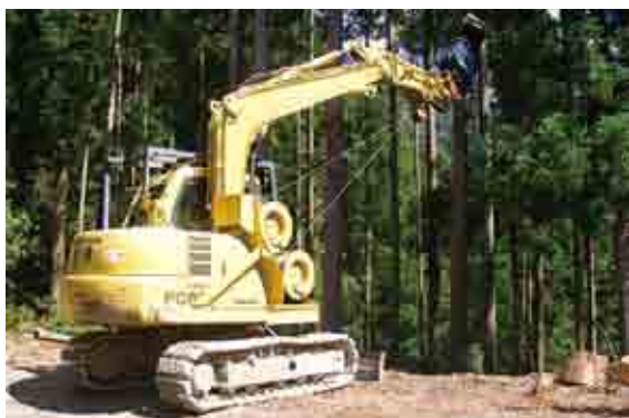
スイングヤード 搬出の現場で使用する高性能林業機械

タワーヤード、スイングヤードなどの 高性能林業機械 を導入し、安全で効率的、かつ低コストで搬出できるシステムの構築が求められています。搬出のシステムができれば、原木を加工場や市場に安定供給することができます。また、事業体が高性能林業機械の購入やリースをする場合は、村から補助が受けられます。