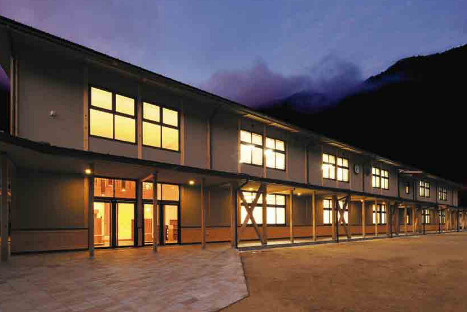
十津川中学校の外観(大字小原・十津川中学校)