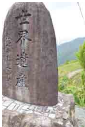
大峯奥駈道は玉置山のかつえ坂に、熊野参詣道小辺路は桑畑の果無集落に世界遺産登録の記念碑が建つ(写真は果無集落)

村に大きな被害を与えた明治22年の大水害のときも、小辺路をとり当時2600人余りが北海道に新天地を求めて村を後にした歴史があります。 世界遺産の「道」は、村にとって大切な宝物です。10周年にあたり今一度、意義を振り返り、次の1000年先まで残していくことが、私たち村民に課せられた使命だと感じます。