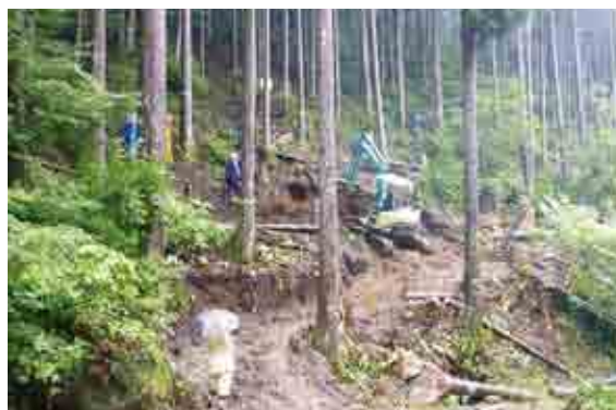
村有林を使った低コスト作業道の開設

境界が明確になれば山林を 団地化 し、林内に木を出すための 道（作業道） を開設することができます。作業道にも、いろいろな種類がありますが、 急峻な村の山林 に適したもので、 なおかつ安全・低コスト の道が求められています。低コストの作業道の開設を進めるため、 村有林 などで、 林業就業者 を対象に講習を行っています。