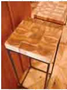
フラワースタンド (大字平谷・十津川 温泉ホテル昴)