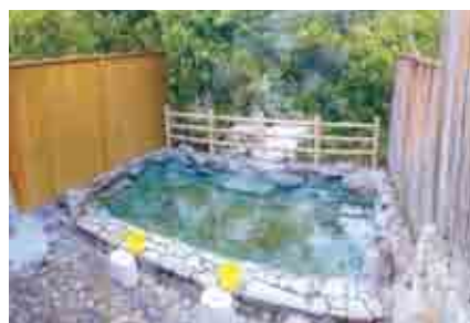
露天風呂から十津川の溪流と対岸の緑が一望できる湯泉地温泉「泉湯」

「本当に心も体も癒してもらえるには源泉かけ流ししかない」 村では、循環式の浴場などの施設を「かけ流し」に切り替え、すべての温泉宿や公衆浴場が「源泉かけ流し」となりました。