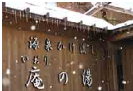
十津川温泉「庵の湯」。寒い冬でも温泉でからだの芯から温まる