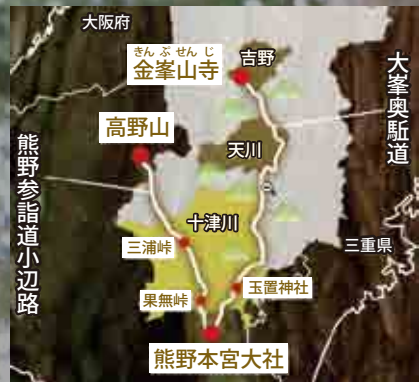
奈良県観光ガイドブックより