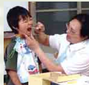
磨き残しはありませんかー？

村内12歳児のDMF指数（永久歯が虫歯になったことのある歯の数）は、平成25年度の「県平均0.99」をはるかに上回る「平均6.42」で、「県内ワースト1位」の結果が出ています。