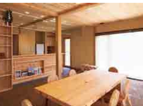
十津川産材のぬくもり広がる木灯館内

橿原市曲川町にある十津川の森「木灯館」は、ヨーロッパの省エネ基準を満たし、さらに2020年省エネ住宅基準をも満たしている住宅づくりの先端を行く建物です。この環境に配慮した家から十津川産材の良さを発信していきます。