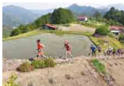
世界遺産の道では、山岳マラソン(トレイルラン)などのイベントも行われている