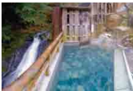
湯泉地温泉「滝の湯」。休憩所や食事処もある